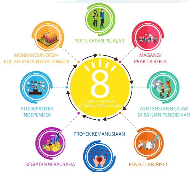
Gambar 1. Kegiatan pembelajaran sesuai Permendikbud No. 3 Tahun 2020 Pasal 15 Ayat 1

Selaras dengan pembelajaran Kampus Merdeka, kegiatan PKM diharapkan dapat memberikan kesempatan dan tantangan dalam pengembangan kreativitas, inovasi, dan kapasitas, serta kemandirian dalam mencari dan menemukan pengetahuan atau solusi melalui masalah dan dinamika yang ada di masyarakat. Penjelasan rekomendasi konversi sks dapat dilihat di Buku Panduan Umum PKM. Menurut Permendikbud No. 3 Tahun 2020 Pasal 15 Ayat 1, bentuk kegiatan pembelajaran yang sesuai dengan PKM-RE adalah Riset dan Studi/Proyek Independen seperti terlihat dalam Gambar 1.